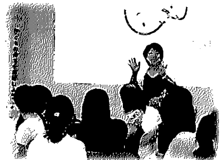
▲25年度第1回公開講座(7/30於:名張市)