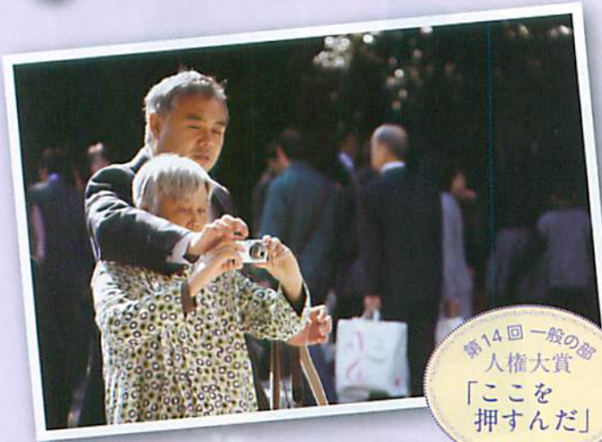
第14回一般の部 人権大賞 「ここを 押すんだ」