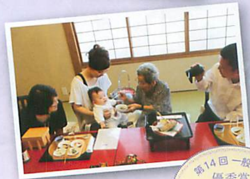
第14回一般の部 優秀賞 「お食い初め」

「自分らしく生きる姿」「共に生きる姿」「命の大切さ」をテーマに、「人権フォトコンテスト」を開催します。 家庭・学校・職場・地域などで、自分の身近な人びとやその生活を「人権」という視点から感性で捉え、写真にしてください。 このコンテストは、すべての県民の人権が尊重される住みよい地域社会の実現をめざします。