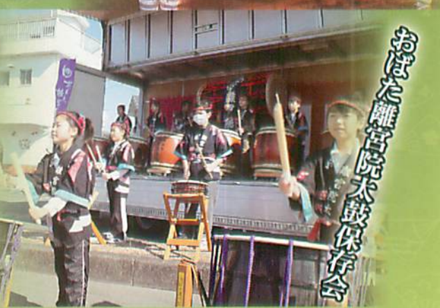
おぼた離宮院太鼓保存会