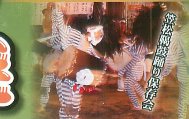
笠松鞆鼓師り保存会